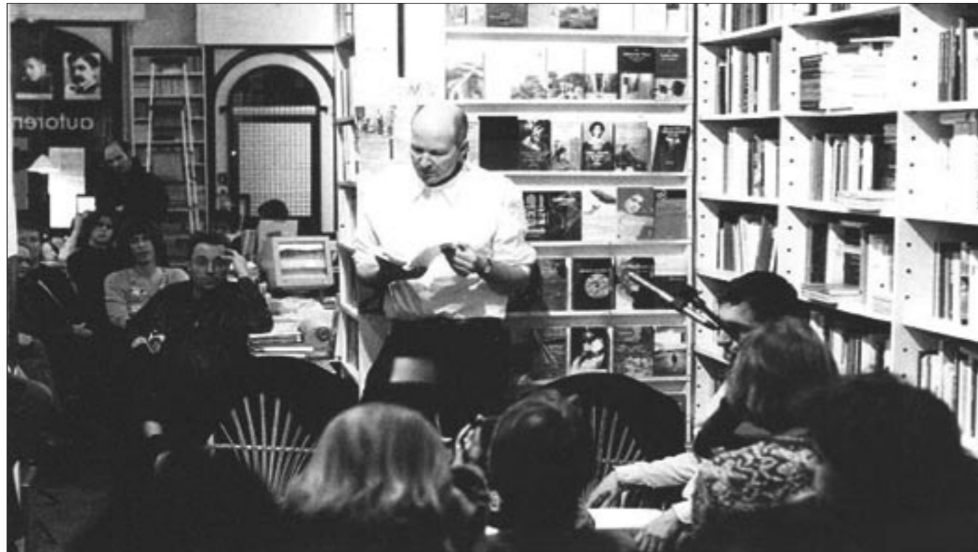
Jean-Philippe Toussaint bei einer Lesung im autorenladen Berlin